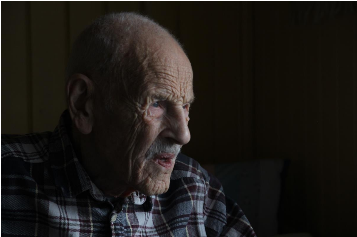
Siste opphold på Toppen, tidlig november 2021.

Siste tur til Toppen var i november, og nå på onsdag sovnet han fredelig inn med sine nærmeste rundt seg.