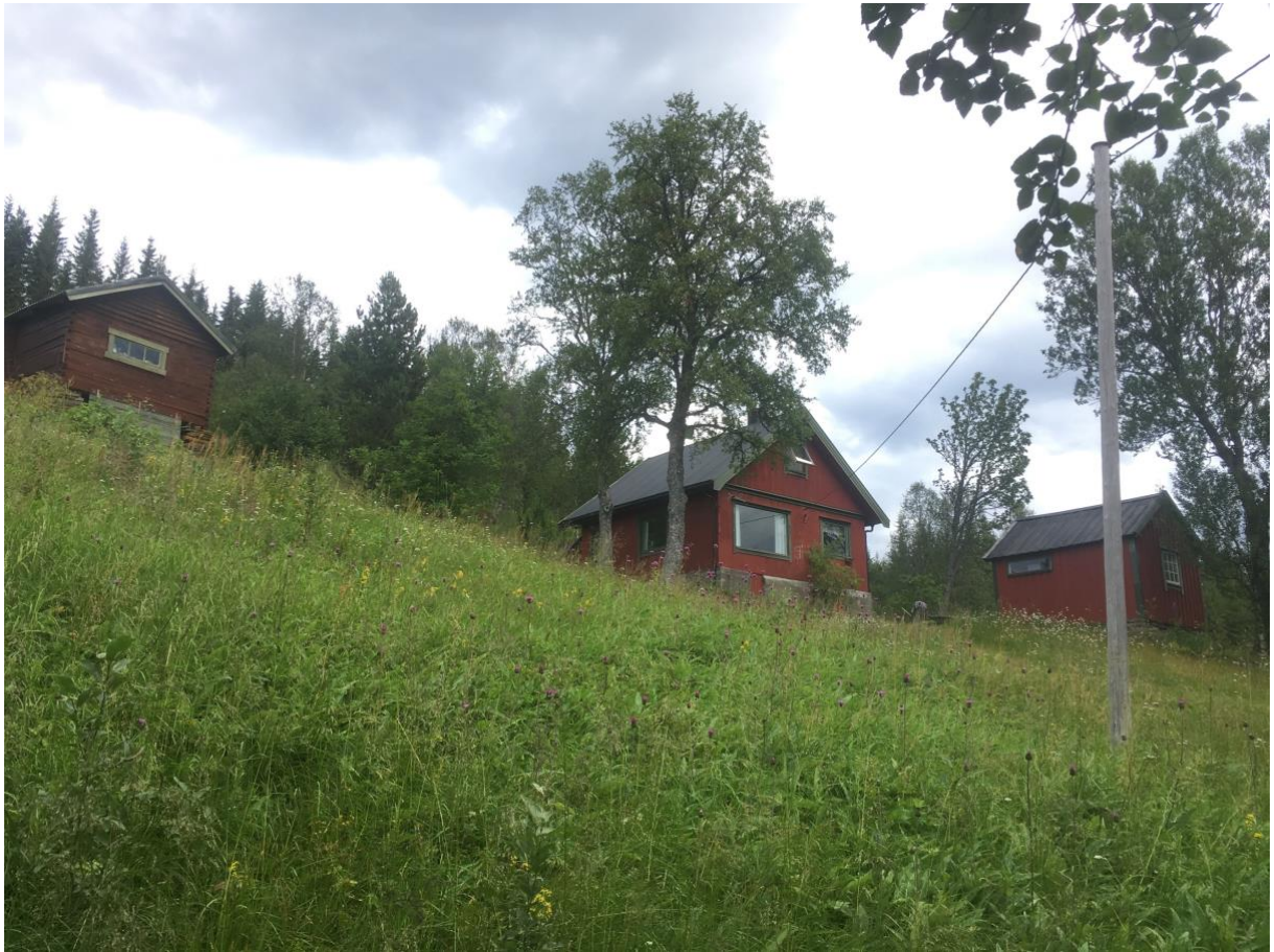
Rydningen på Toppen; Huset, og utsikten...